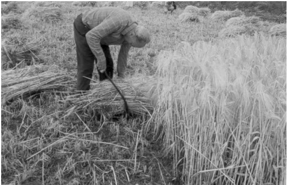
Figura 2. Festa del Segar a Lluçà (26 de juny de 1994). La imatge recull la sega i la preparació de les garbes.

Igualment, per obtenir una aproximació a l'agricultura, cal tenir presents les anàlisis palinològiques, antropològiques, l'estudi de la fauna present al jaciment, etc. El conjunt d'aquestes anàlisis permet formar-se una idea de l'entorn de l'home medieval, la quantitat de massa forestal i de superfície conreada existents, les característiques de l'alimentació humana, la determinació de les espècies vegetals conreades, i també la determinació dels animals que es criaven per al consum, per al transport o per al treball.