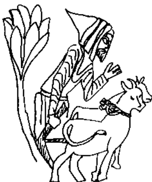
Figura 1. Representació d'Adam tornant de llaurar; s'hi pot veure una arada romana o simètrica. Capítell del Claustre de Santa Maria de l'Estany (s. XII-XIII).

Respecte a la miniatura la Biblia de Vic , de 1268, conservada a l'Arxiu Episcopal de Vic i que figura en el catàleg com a Museu Episcopal de Vic. Manuscrit 1 (XXII). La Biblia consta de dos volums i conté alguna escena sobre ramaderia. Donada la mancança d'imatges de caràcter agrícola en la miniatura conservada a Osona, cal buscar altres fonts que permetin obtenir referències sobre eines o formes d'utilitzar-les; per exemple, el Beatus de Girona , de l'any 975 (catedral de Girona), el Comentari de l'Apocalipsi del Beat de Liébana (Biblioteca Nacional de Torí, ms. lat. 93. fol. 140 r.), la Biblia de Rodes (París, Biblioteca Nacional, ms.,